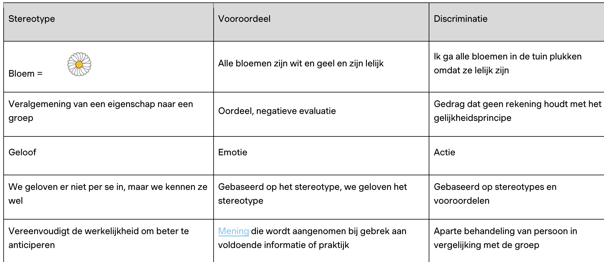
Tabel 1: kenmerken van stereotypes, vooroordelen en discriminatie